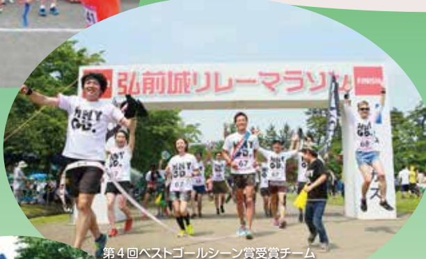
第4回ベストゴールシーン受賞チーム ハニーグッド